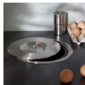
Découpe pour poubelle à encastrer à l'unité