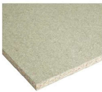
Bois sous plan si table en coupe d'onglet