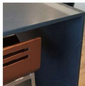
Polissage deuxième face jambage