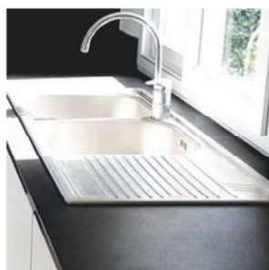
Découpe brute pour évier à poser par-dessus à l'unité