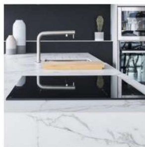
Découpe brute pour plaque de cuisson à poser par-dessus à