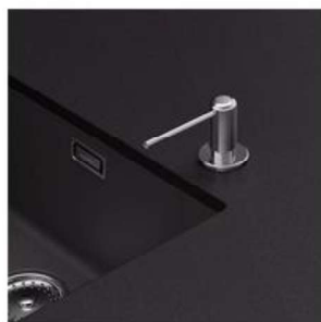
Perçage robinet ou vider auto ou distributeur de savon