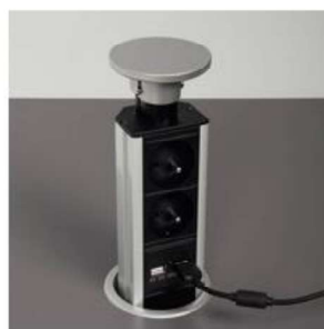
Découpe pour prise télescopique