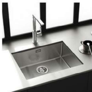
Découpe pour cuve à coller par-dessous à l'unité