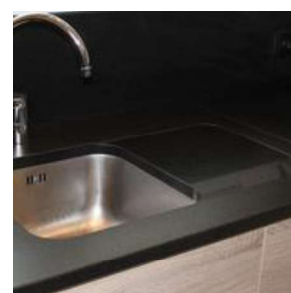
Elaboration d'un petit décaissé