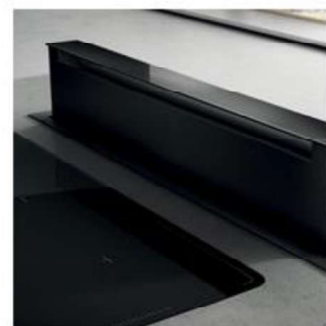
Découpe brute pour hotte à poser par-dessus à l'unité