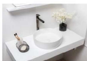
Découpe pour vasque de sdb par dessus