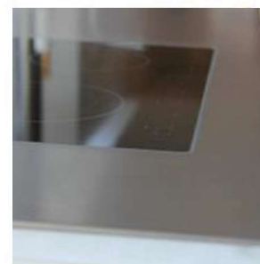
Découpe pour encastrément à fleur avec assemblage (Tolérance+ ou - 2 mm)