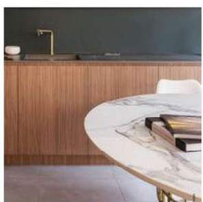
Supplément pour forme spéciale